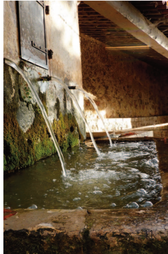
La Grande Fontaine

Ce fleuve se faufile dans la plaine d'Opio, rejoint Valbonne, puis Biot et se jette dans la Méditerranée. Son importance dans l'implantation de ces villages est bien entendu non négligeable.